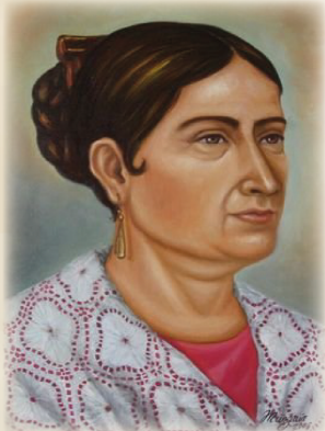
Josefa Ortiz de Domínguez

Pero como siguen siendo "inferiores" a los hombres, ganan sólo la mitad de lo que ellos perciben. Para las mujeres de clase alta, las cosas son ligeramente mejores. Algunas de ellas han comenzado a ganar espacios públicos y gracias a sus esfuerzos están surgiendo instituciones como la Junta de las Señoras de la Casa de Cuna.