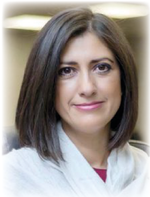
Lorena Cruz -Presidenta de (INMUJERES)

Mucho se habla sobre la igualdad de género en México y el mundo pero, ¿es posible alcanzarla? ¿Qué debemos hacer para avanzar en este tema?