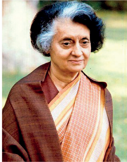
Indira Gandhi ( Allahabad 1917 / Nueva Delhi 1984)

La Revolución Rusa de 1917 legisló en favor de salarios igualitarios para hombres y mujeres. En la etapa de posguerra, la mujer se negó rotundamente a regresar a las faenas caseras e impuso sus experiencias productivas y encomienda social para acentuar en el movimiento obrero internacional de su derecho a la igualdad plena, con el antecedente de la celebración en 1911, del Día de la Mujer.